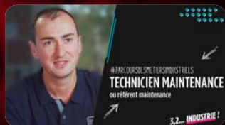
Technicien de maintenance BCF LIFE SCIENCES